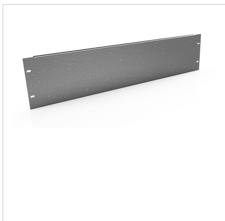
PUA płyta montażowa uniwersalna